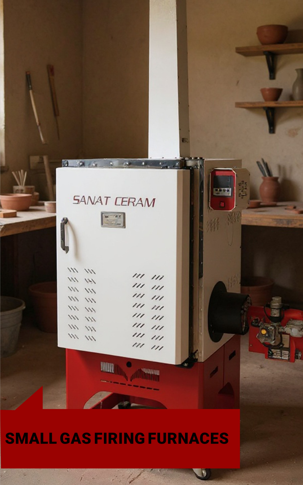
SMALL GAS FIRING FURNACES